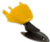
Schneidekopf mit Fuß